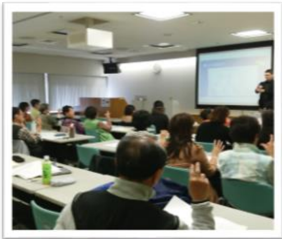
2015年4月 異文化体験セミナーの様子（アメリカ手話）

これまで開催された体験セミナーでは、国際手話、アメリカ手話、中国手話、韓国手話など異文化体験を通じて国際交流企画等実施しています。