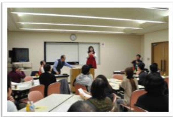
2015年11月 国際手話体験セミナーPART2の様子

これまで開催された体験セミナーでは、国際手話、アメリカ手話、中国手話、韓国手話など異文化体験を通じて国際交流企画等実施しています。