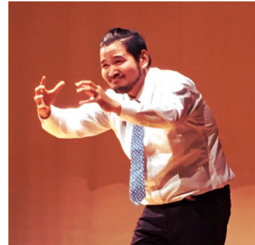
今井彰人（俳優、演出、映画監督）